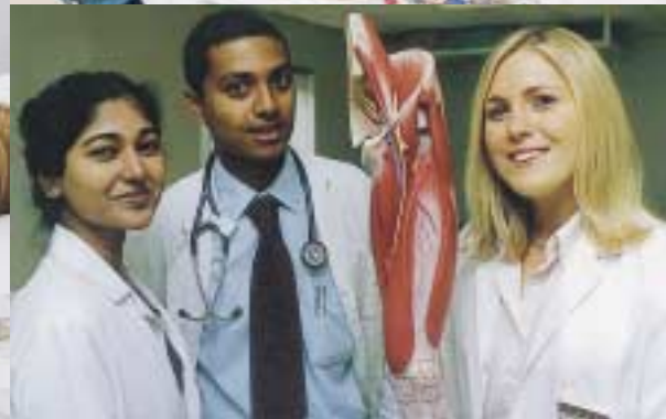
A GAUCHE À DROITE, EN HAUT ET EN BAS : London Picture Service/ Foreign & Commonwealth Office