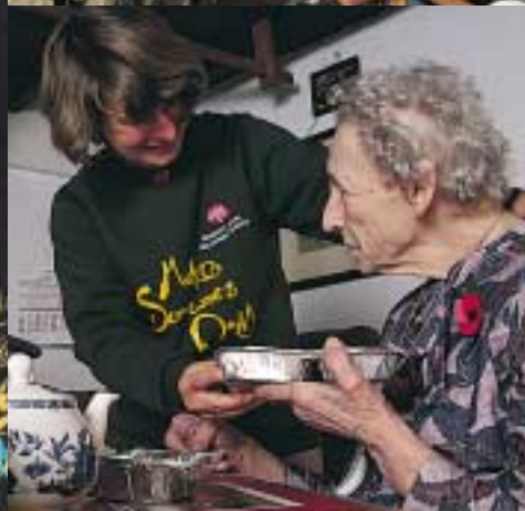
A GAUCHE : City of Westminster A DROITE EN HAUT : Great Ormond Street Hospital EN BAS : Women's Royal Voluntary Service